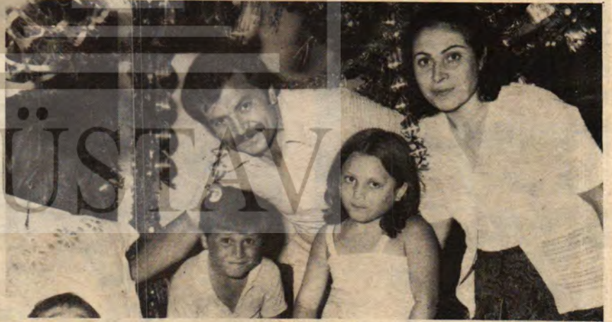
Esi ve çocuklarıyla

TÖB-DER İstanbul Şubesinde işçi sınıfının savaş yolunda yürüyen öğret-