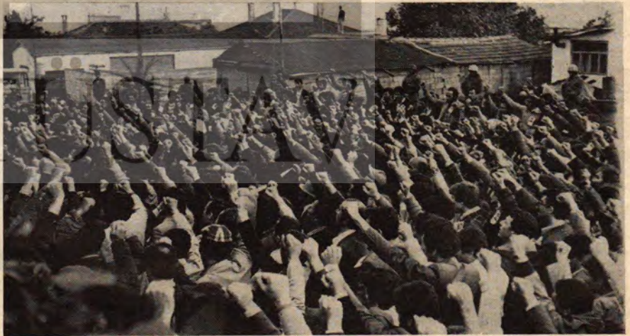
Arkadaşları mezarı başında devrim andı içiyor.