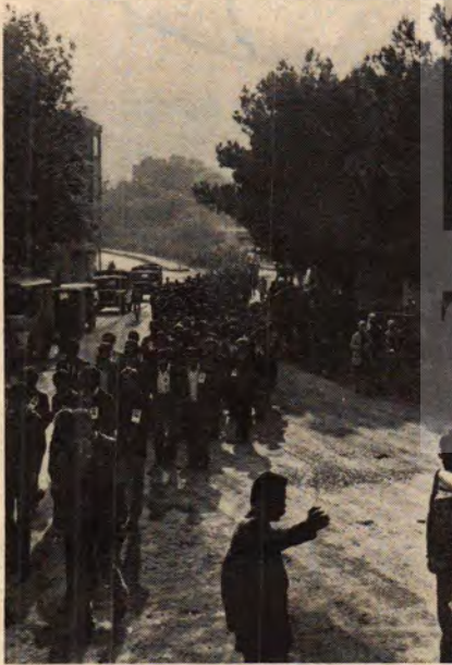
Yığın çocuklar, taşları bırakıp cenazesine aştılar.